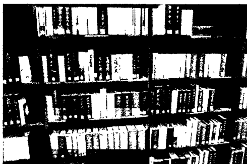
函館図書館内にて