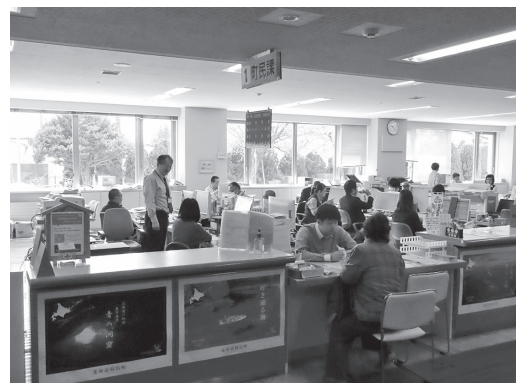
統合された町民課

○道路の構造の技術的基準等を定める条例の一部改正 道路構造令の改正に伴い、自転車通行帯の技術基準等を追加するための一部改正。